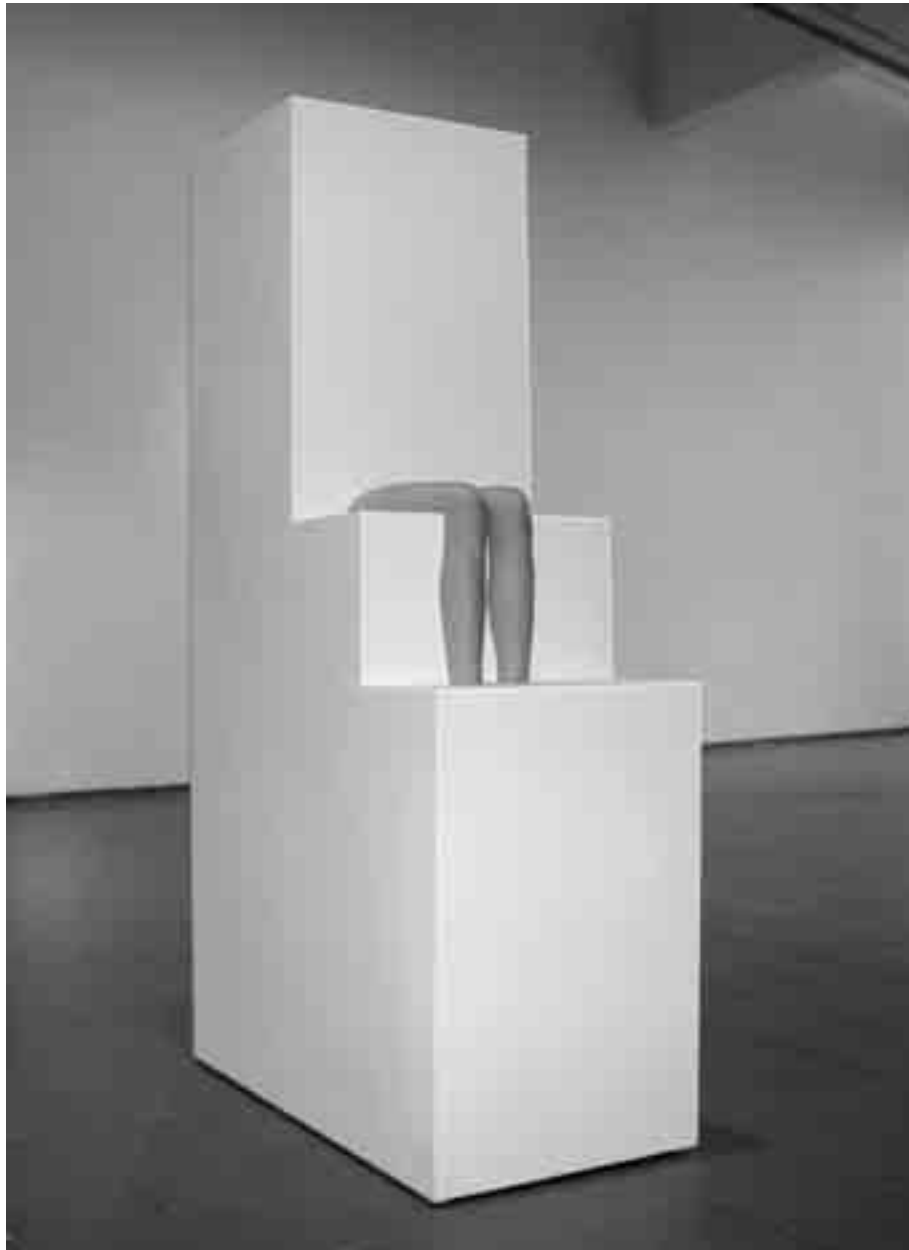
1. Max Seibald scultura vivente , Rauminstallation 2003