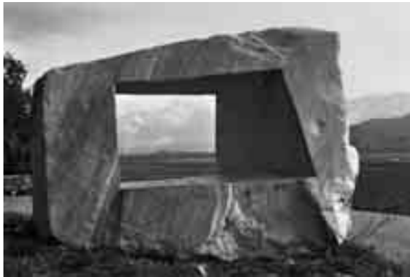
72. Helen Howe Steinbruchstücke , 1977 Krastaler Marmor, 140 x 40 x 40 cm