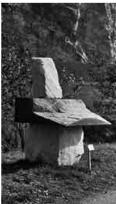
68. László Sztákos Melancholie , 1990 Krastaler Marmor, ca. 150 cm hoch